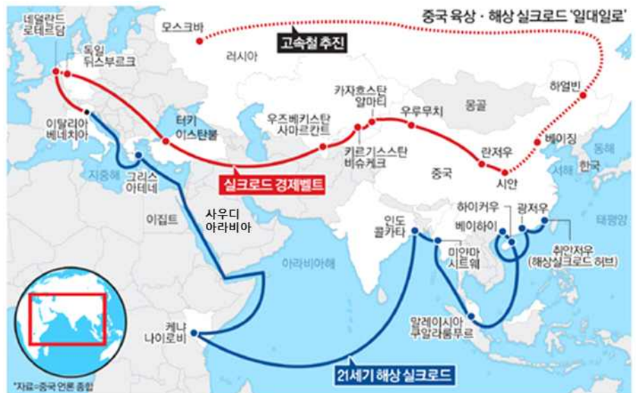
그림 1. 중국 일대일로 이니셔티브 (레드라인: 육상로드, 블루라인: 해상로드)